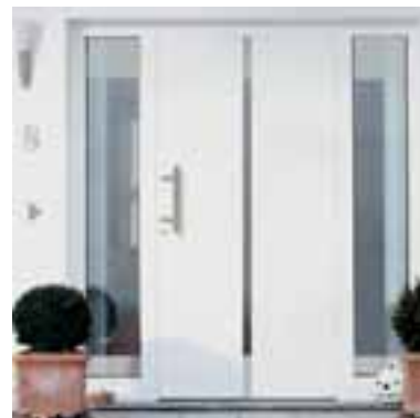
Design, Komfort und Flexibilität perfekt kombiniert.

Beide Systeme zeichnen sich durch hohe Betriebssicherheit aus. Fingerabdrücke bleiben nicht auf der Oberfläche des Sensors zurück sondern werden elektronisch umgewandelt. Signale der Funkfernbedienung werden stets verschlüsselt übertragen. Eine Manipulation ist ausgeschlossen.