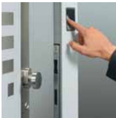
Der Fingerprint-Sensor wurde bislang vor allem in industriellen Sicherheitsbereichen eingesetzt.

Jedes Modell wird speziell nach Ihren Wünschen und Anforderungen hergestellt – von Ihrem Schüco Partner ganz in Ihrer Nähe. Sprechen Sie uns an.