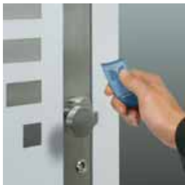
Das ergonomische und formschöne Design des Senders sorgt für die leichte Handhabung der Funk-Fernbedienung.

Nutzen auch Sie die Flexibilität dieser vielfach bewährten Systeme. In den designorientierten Aluminium-Haustüren von Schüco setzen sie einen besonderen Akzent – und das Beste ist: der Einbau in bestehende Türen ist natürlich auch möglich.