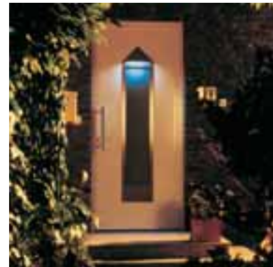
Sicherheit mit individuellem Design durch Form-, Farb- und Dekorvielfalt.

So viel Sicherheit sieht auch gut aus. Schüco bietet eine Vielzahl designorientierter Modelle für anspruchsvolle Bauherren