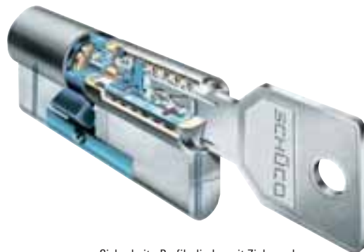
Sicherheits-Profilzylinder mit Zieh- und Aufbohrschutz. VdS-zugelassen (Klasse B).